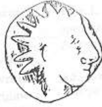
الإله "هليوس" (٩ - أ)