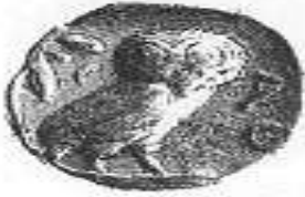
البومة (١ - ب)