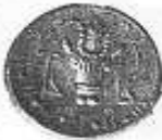
رأس ثور و بجانبه قرن الخيرات (١٢ - ب)