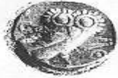
البومة (٢ - ب)

Mnuro-Hay S. C., Coins of Ancient South Arabia II , op. cit., pl. 12.