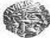
الإلهة "أثينا" (٣ - أ)