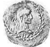
الإمبراطور "أغسطس" (١٠ - أ)