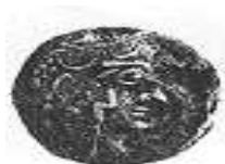
البومة (٧ - ب)