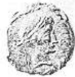
الإمبراطور "أغسطس" (١١ - أ)