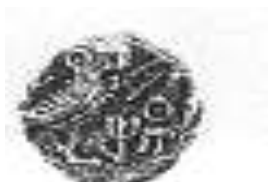
البومة (٦ - ب)