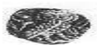
البومة (٥ - ب)