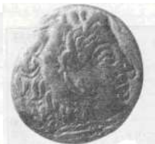
"الإسكندر الأكبر" (٢٢ - أ)