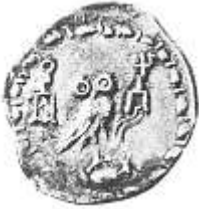
اليومة (١٠ - ب)

Sedov A. V. & Aydarus U., The Coinage of Ancient Hadramawt, "The pre-Islamic Coin in the al-Mukallâ Museum" , op. cit., p.18.