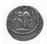
رأس لحاكم عربي (١٣ - أ)