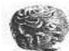
الإلهة "أثينا" (٥ - أ)