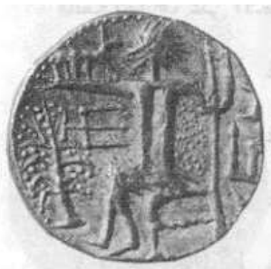
الإله "زيوس" (٢٣ - ب)