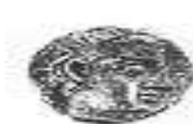
الإلهة "أثينا" (٦ - أ)