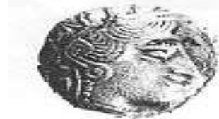
الإلهة "أثينا" (٢ - أ)