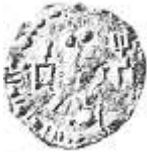
اليومة (١١ - ب)

Without Writer: Sylloge Nummorum Graecorum , op. cit., pl. 51.