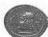
رأس لحاكم عربي (١٢ - أ)