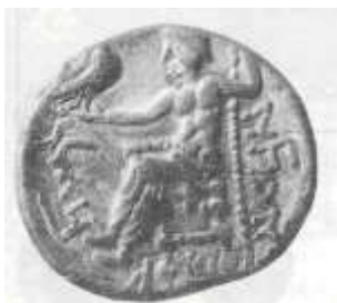
الإله "زيوس" (٢٢ - ب)