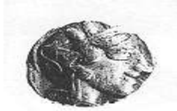
الإلهة "أثينا" (١ - أ)