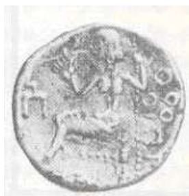
الإله "زيوس" (٢٠ - ب)