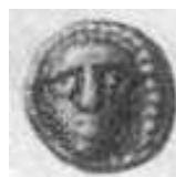
الإله "أبوللو" (٢٤ - أ)